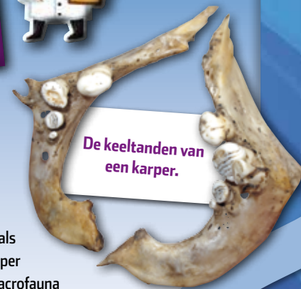
De keeltanden van een karper.

dankzij hun uitstulpbare bek zelfs in een dikke modderlaag vinden. Er zijn ook vissoorten die keeltanden hebben, speciaal om slakjes en mosseltjes te kunnen kraken en opeten. Voorbeelden hiervan zijn de blankvoorn, winde, zeelt en karper.