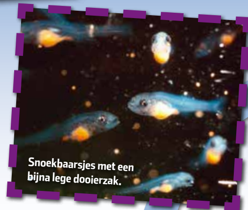
Snoekbaarsjes met een bijna lege dooierzak.