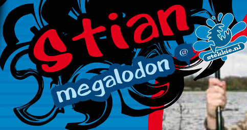
Stian voert eerst de eendjes, dan komen de brasems vanzelf.

Wil jij ook met jouw foto in Stekkie Magazine? Maak dan een profiel aan op Stekkie.nl , upload een foto in hoge resolutie en vul de vragenlijst in!