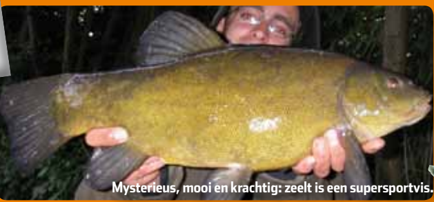
Mysterieus, mooi en krachtig: zeelt is een supersportvis.

Minischubjes, orangerode kraallogjes en een mysterieus goudgroen lijf: zeelt is een schitterende vis om te zien. Daarbij zorgt zijn machtige staartvin voor flink wat power. Zo'n vis wil iedereen wel vangen. Maar waar en hoe doe je dat?