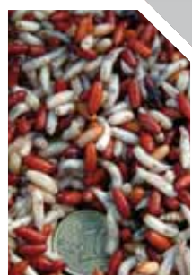
Maden en casters, maïs, miniboilies en pellets; zeelt lust het alle