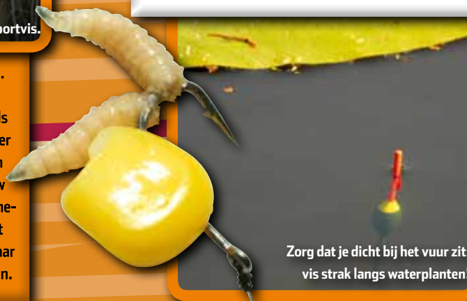
Zorg dat je dicht bij het vuur zit: vis strak langs waterplanten!