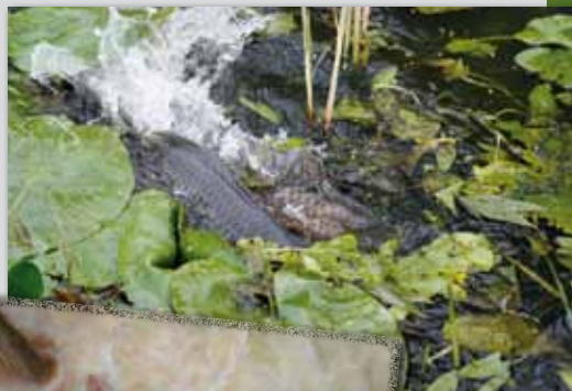
Bij de paai gaat het er soms wild aan toe.

Van de duizenden eitjes die bij de paai in het water terecht komen, hechten de meeste zich daarna snel vast aan waterplanten. Uit het eitje komt na een paar dagen een vislarfje tevoorschijn, dat binnen een paar weken al op zijn vader en moeder gaat lijken. Nog veel later kunnen deze visjes zelf uitgroeien tot écht grote dames en heren. Al wordt lang niet ieder eitje een kanjervis.