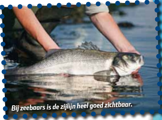
Bij zeebaars is de zijlijn heel goed zichtbaar.

Als je gaat vissen moet je voorzichtig langs de waterkant lopen, anders voelen de vissen jouw voetstappen als trillingen in het water en weten ze dat ze op hun hoede moeten zijn. Ook hard praten zorgt voor trillingen in het water, dus schreeuwen langs de waterkant zal je vangsten niet ten goede komen!